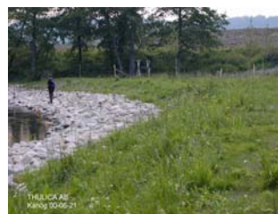
Väletablerad Juni 2000

För information, kontakta oss per brev, E-mail telefon eller telefax eller se vår hemsida www.thulica.com .