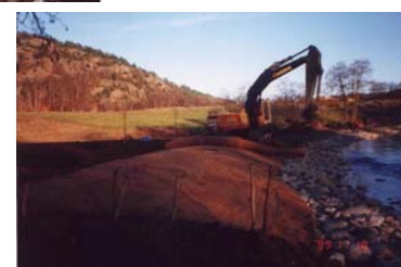
Utläggning av erosionsmatta