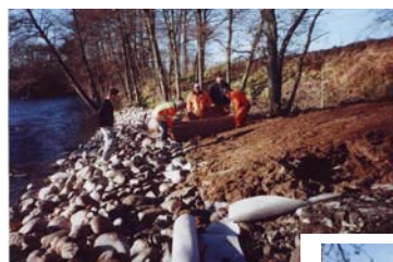
Vegetationsskikt på bank