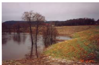
Extremt vattenstånd December 1999