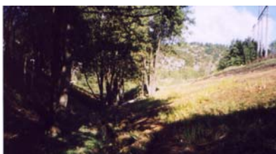
Oktober 1999, efter åtgärd