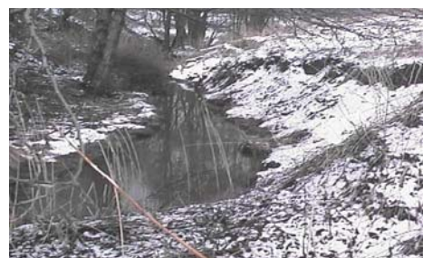
Mars 1999 Före åtgärd